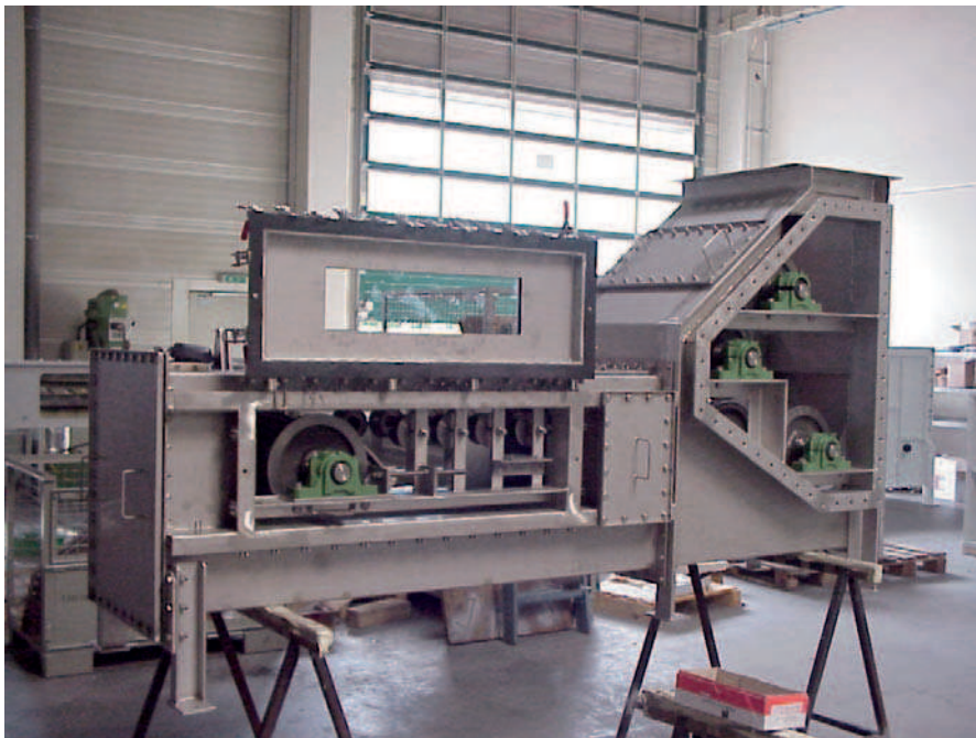
Endmontage der Fußstation eines gasdichten Winkelbecherwerks der Baureihe WB 300

Auch druckstoßfeste Ausführungen sind auf Wunsch möglich.